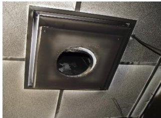
התקנה של ונטה שלא הייתה מוגנת מפני התפוצצות