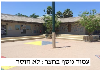
עמוד נוסף בחצר: לא הוסר