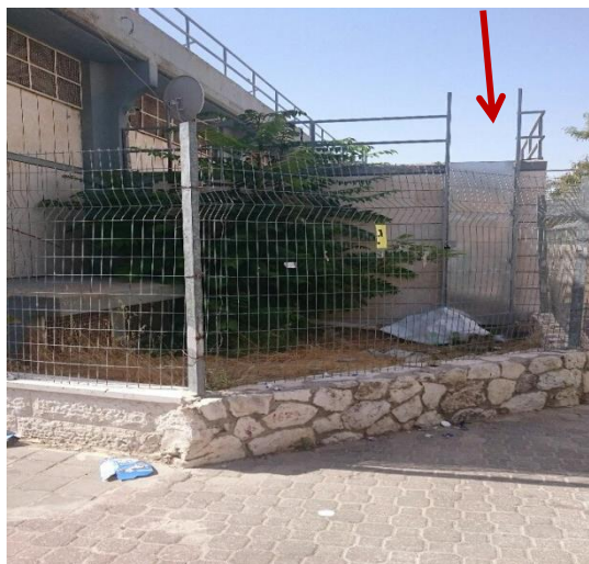
אלמנט הטיפוס אל גג קומת הקרקע