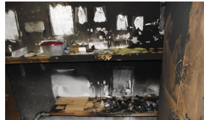
ארונות ומדפים מחומרים לא דליקים היו מצמצמים מאד את בעירת המחסן