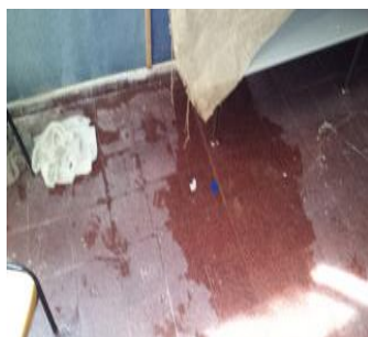
הצטברות המים שמחלחלים מהקיר