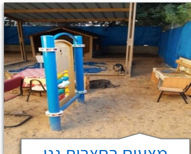
מצעים בחצרות גני ילדים ובבתי ספר