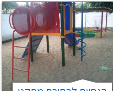
הנחיות לבחירת מתקני משחק לגני ילדים