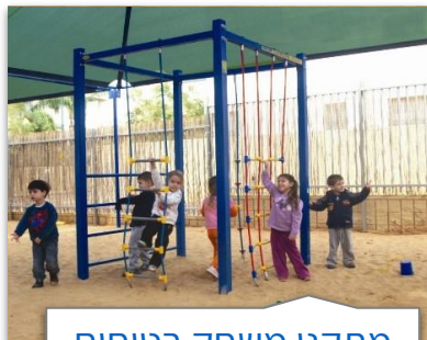
מתקני משחק בטוחים לגני ילדים