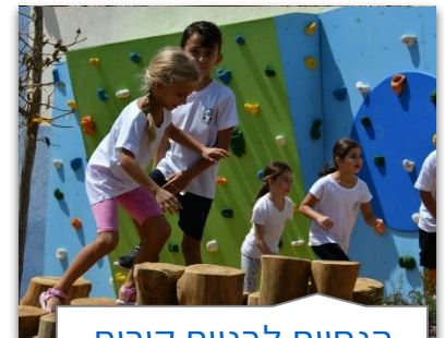
הנחיות לבניית קירות טיפוס במוסדות חינוך