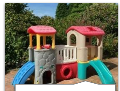
מתקני משחק שאינם עומדים בתקן 1498