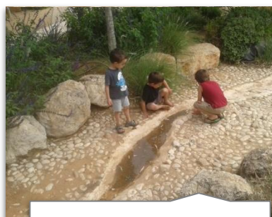
הנחיות תכנון ובטיחות ב"חצר טבעית"