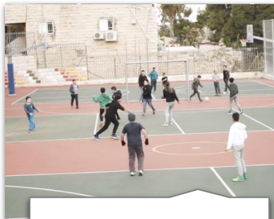
בדיקת מתקני כדורסל