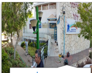
רשימה מנחה לעריכת מבדק בטיחות