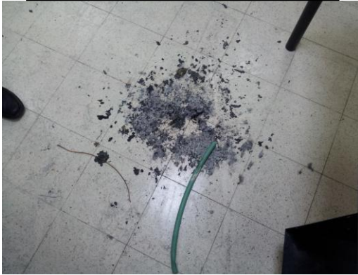
סימני טפטוף החומר על