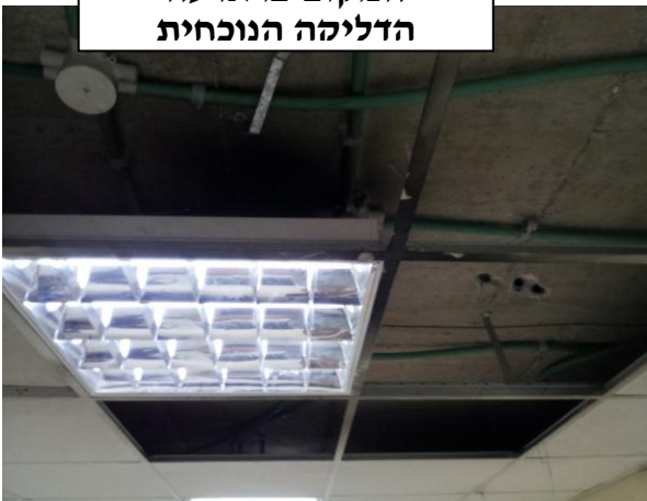
המקום בו ארעה הדליקה הנוכחית