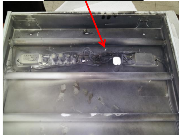
חיווט גוף התאורה-